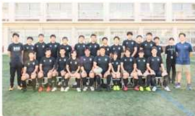
箕面学園高校ラグビー部