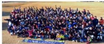
箕面ラグビースクール